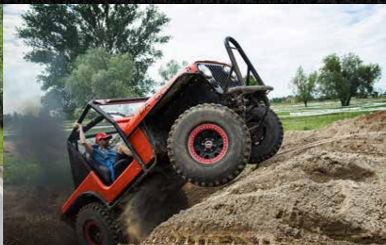
EXTREME 4X4 OFFROAD