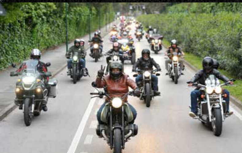
SATURDAY LIGHT PARADE