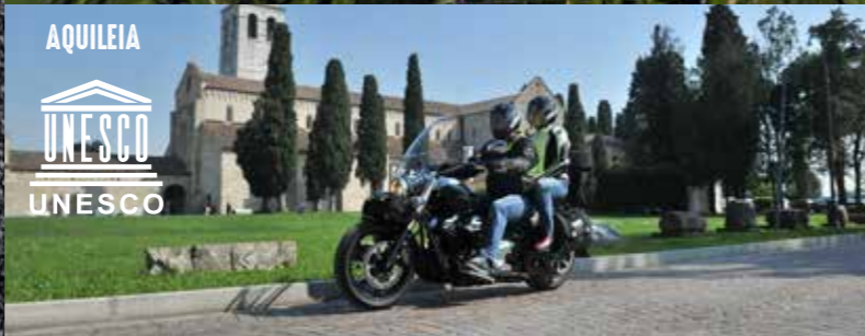
AQUILEIA UNESCO UNESCO