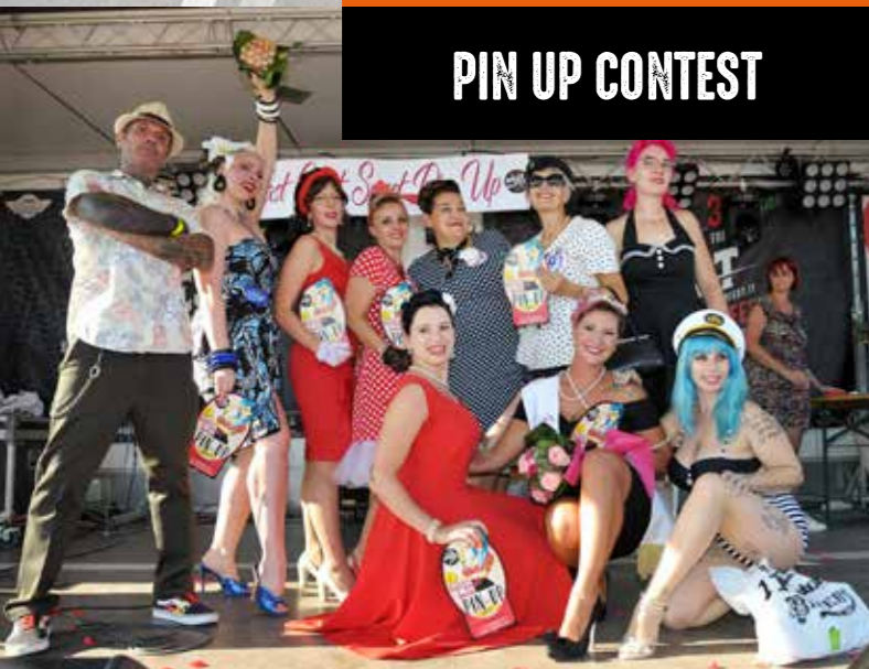
PIN UP CONTEST