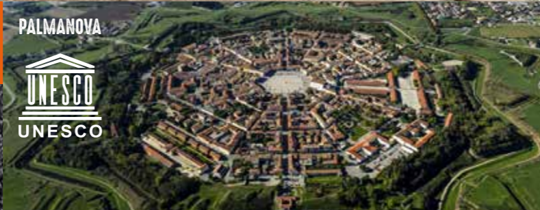
PALMANOVA UNESCO UNESCO