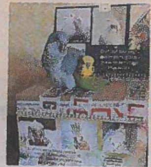
I calendari dei pappagalli